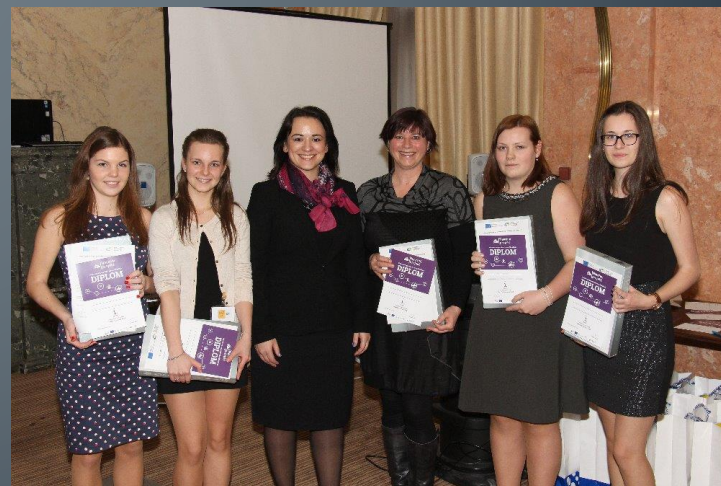
1. místo v celorepublikové soutěži Navrhni projekt z r. 2015