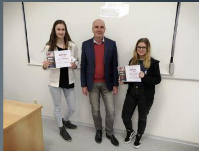
3. místo v soutěži MD DAL r. 2020